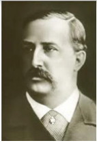
Alexandre Borodine (1833-1887) Compositeur russe

OU QUELS SONT LES OUTILS DES COMPOSITEURS POUR NOUS FAIRE VOYAGER ?